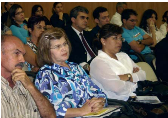
Magistrados do Trabalho e representantes da sociedade civil organizada participaram de ato público da Campanha pela Efetivação do Direito do Trabalho promovido pela AMATRA 21.

No dia em que se comemora os 19 anos da Constituição Federal - 05 de outubro, a Associação dos Magistrados do Trabalho da 21ª Região – AMATRA 21 - promoveu, no auditório do Tribunal Pleno do Tribunal Regional do Trabalho da 21ª Região, em Natal, um ato público para marcar o lançamento da Campanha pela Efetivação do Direito do Trabalho no Rio Grande do Norte.