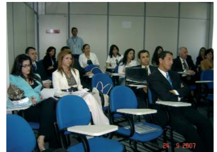
Escola Judicial da 21ª Região promoveu Curso de Técnicas de Conciliação e Aprimoramento para Magistrados do Trabalho.

Foi realizado no período de 24 a 27 de setembro, o primeiro Curso de Técnicas de Conciliação e Aprimoramento do Tribunal Regional do Trabalho da 21ª Região.