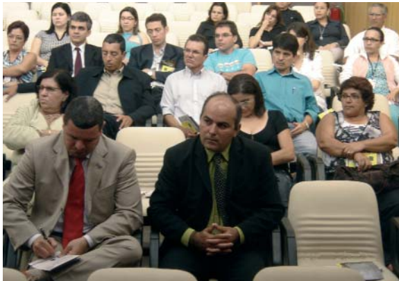
Presidente da ANAT e Representante do MPT da 21ª Região comprometeram-se com o engajamento na campanha no RN.